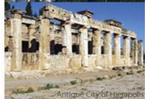
Antique City of Hierapolis